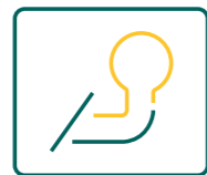
ENGANCHE DE BOLA